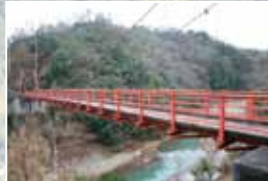
⑤ 八塔寺川ダム公園