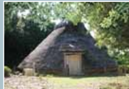
⑥ 古代体験の郷まほろば 野生の鹿