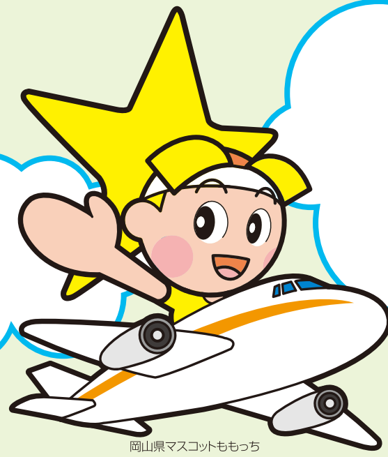
岡山県マスコットもっち