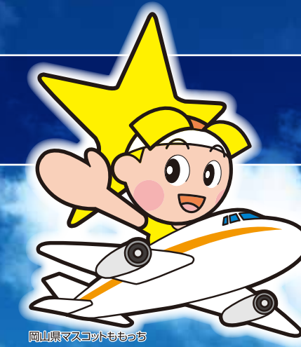
岡山県マスコットもっち