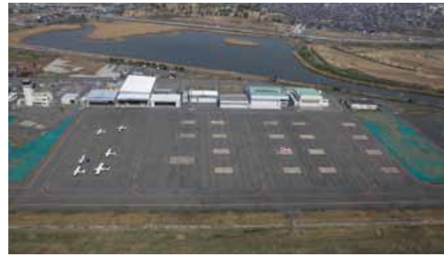
東エプロンと格納庫