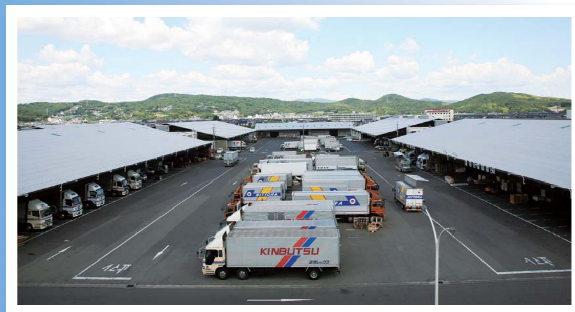
岡山県トラックターミナルの全容写真

中国・四国最大の運輸拠点・・・ 新たな発展を目指し、前進し続ける 「岡山県トラックターミナル株式会社」