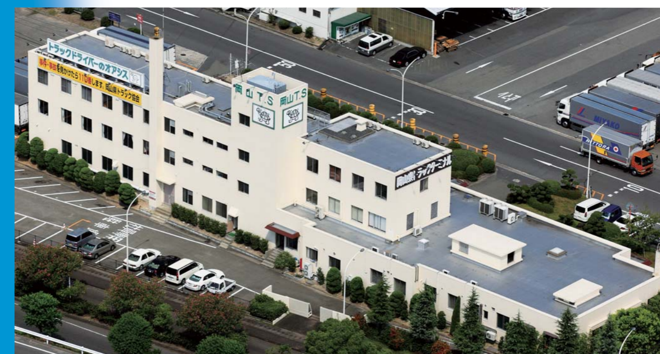
▲トラックターミナルの管理棟